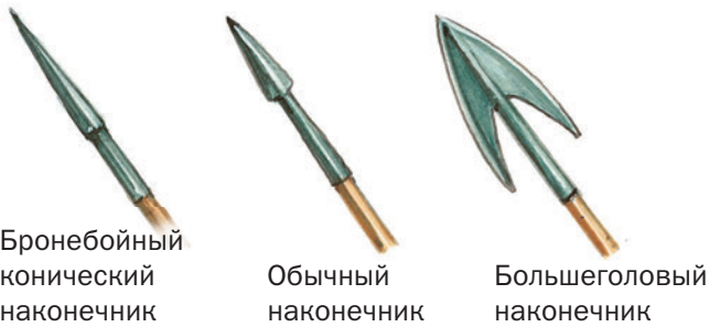
Бронебойный конический наконечник