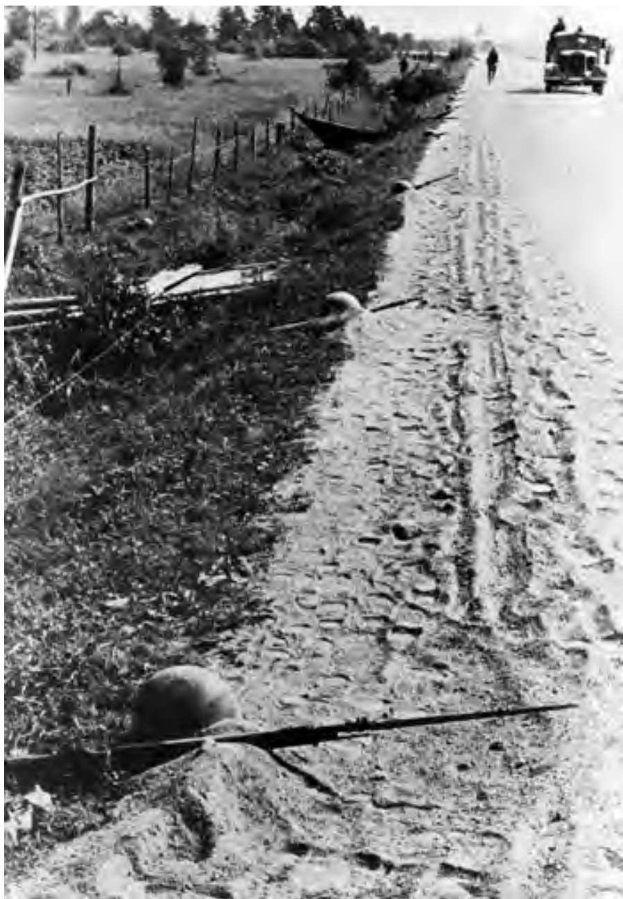
Военная хитрость в отсутствие заграждений и минных полей: отступающие войска Красной Армии выложили на грунте у края придорожной канавы винтовки и шлемы, чтобы создать видимость наличия обороны на этом участке и тем самым задержать продвижение наступающего противника. Снимок сделан немецким фотографом в августе 1941 года.