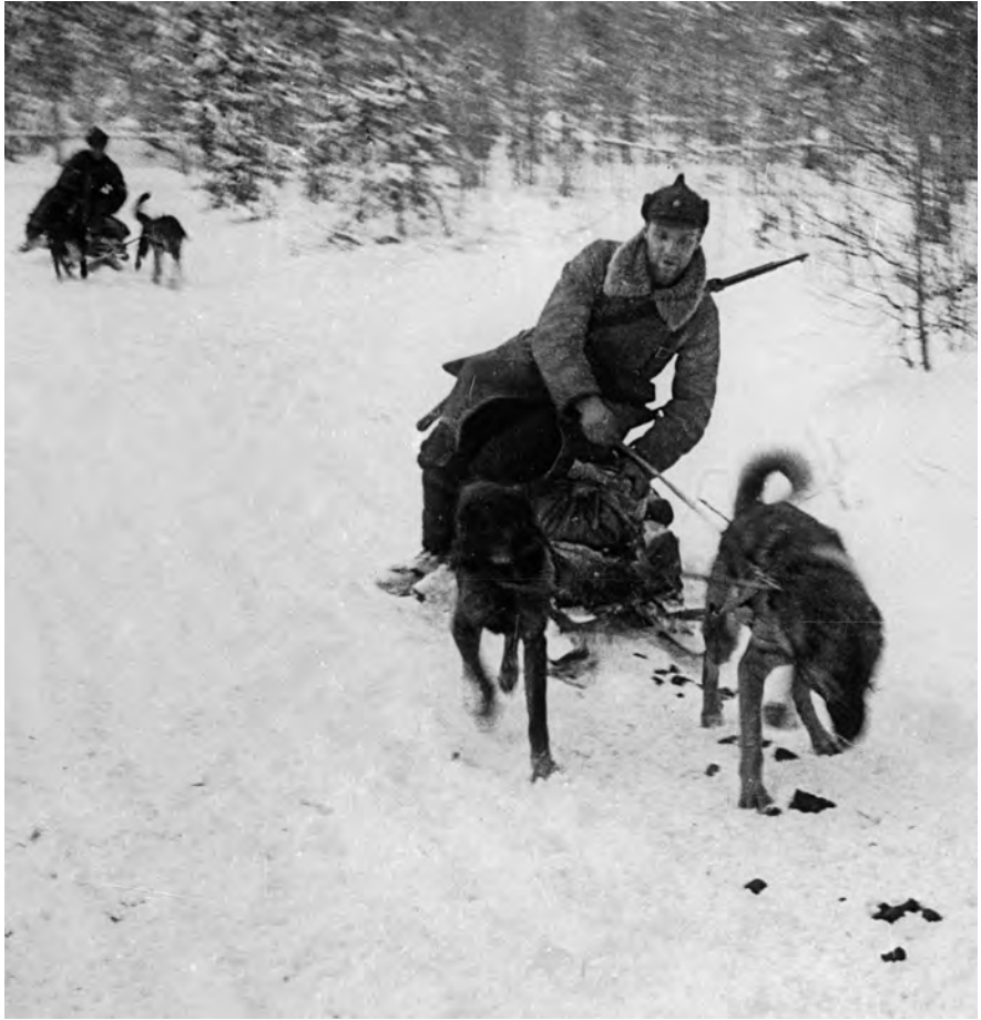
Собачьи упряжки на передовой во время Советско-финской войны (1939–1940 годы).