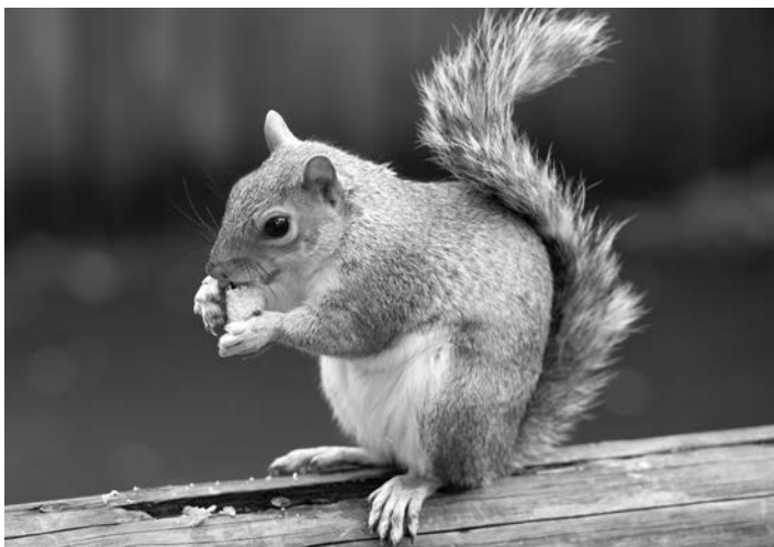
Белка инстинктивно знает, когда следует прекратить есть.

Я невольно задумался: почему белка предпочла приберечь орехи на будущее, а не съесть их тут же?