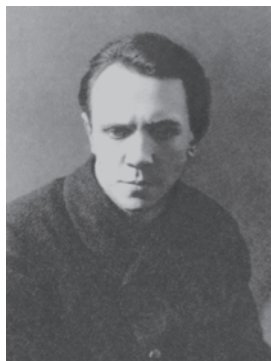
М. А. Чехов

Ее книгу «Освобождение голоса» я перевела в 1993 году на русский язык, внося в нее изменения с учетом особенностей звуков русской речи.